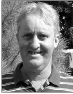
トム・フィールディング

世界を股にかけて活躍するレッスン・プロ、トム・フィールディング氏が初心者からシニアまで誰でも簡単にできるゴルフ練習法を教えるこのコーナー。第1回は飛距離に悩む人たちにパワー・ボールの打つための練習方法を伝授!